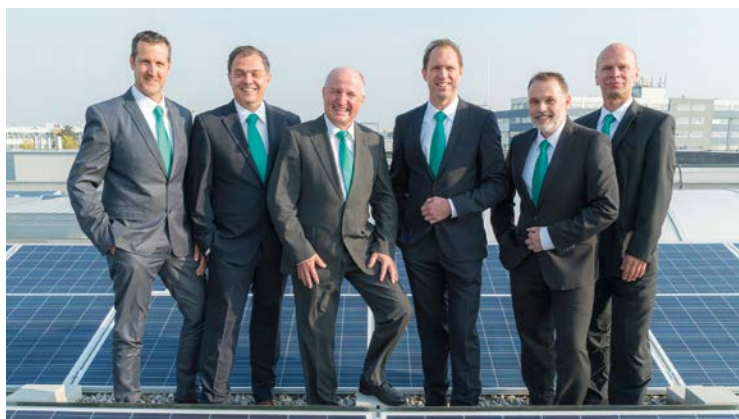
Die Wilo-Führungsmannschaft übernimmt mit der Investition in eine Fotovoltaik-anlage eine sichtbare Verantwortung im Sinne der Energiewende