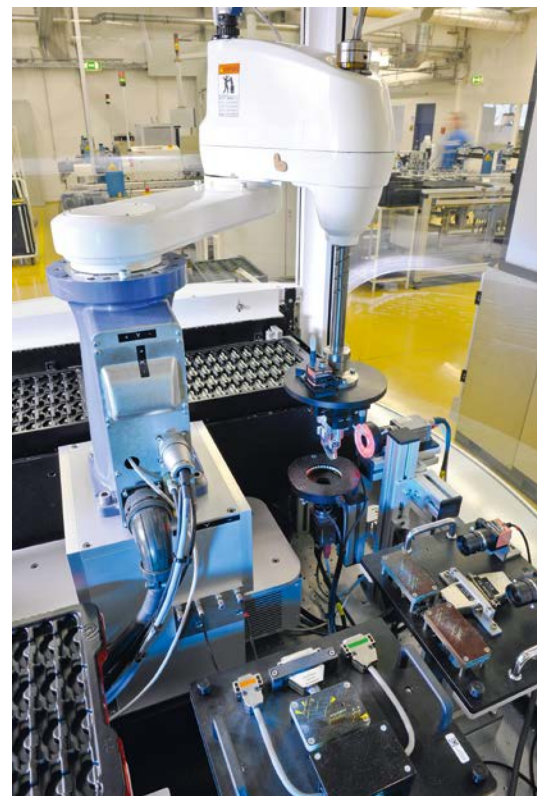
Ein robotergesteuertes Endtestsystem ist ebenfalls von cms auf den Markt gebracht worden