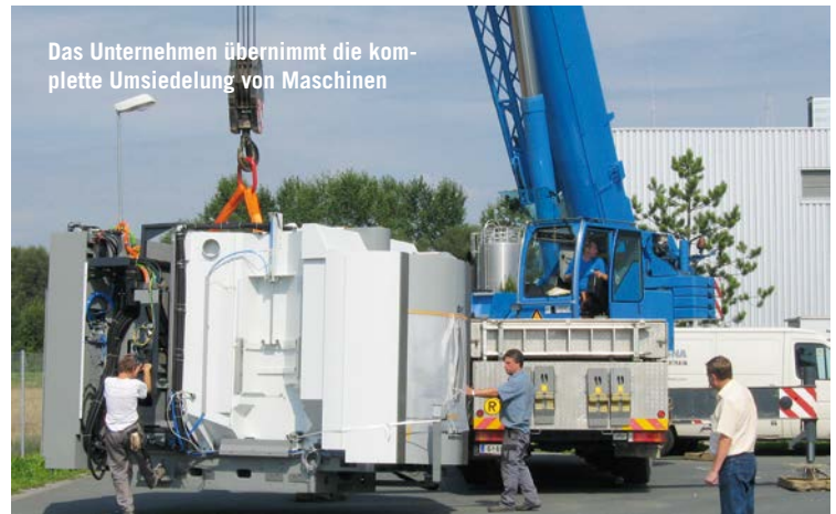
Das Unternehmen übernimmt die komplette Umsiedelung von Maschinen