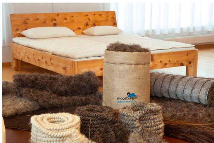
Je nach Verwendungszweck wird Rosshaar in die passende Form gebracht