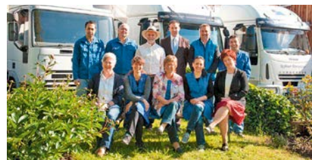
Stehen in fast 120-jähriger Familientradition: die Mitarbeiter der Rosshaar-Manufactur

Rosshaar ist ein selten gewordener Naturrohstoff mit verblüffenden Eigenschaften. In der Polsterei seit jeher hochgeschätzt, liegt heute das Wissen um seine fachgerechte Verarbeitung in den Händen nur weniger Handwerksbetriebe wie der Walter Moosburger KG Rosshaar-Manufactur aus Hörbranz in Österreich. Dort verknüpfen die Mitarbeiter der Rosshaar-Manufactur auf die fünfte Generation tradiertes Handwerk mit neuen Ideen und bringen so die vielen Vorzüge des edlen Füllstoffs in hochwertigen Naturprodukten erst richtig zur Geltung.