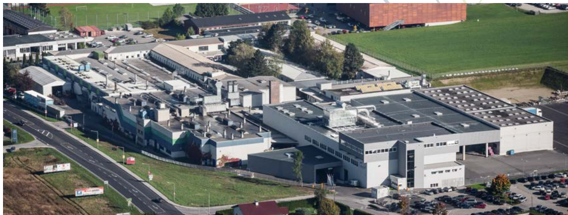
Der Hauptsitz des Unternehmens in Kirchdorf, Österreich