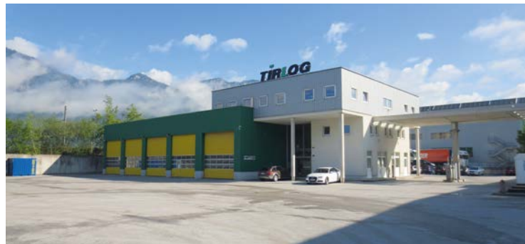
Der neue, 2014 eingeweihte Firmensitz von TirLog in Kirchbichl, Tirol

Drei Meter breite oder hohe Maschinen, Hubschrauber, Bagger oder 20 m lange Holzleimbinder, Übergrößen sind kein Problem für TirLog. „Spezialtransporte von überlangen und überbreiten Gütern haben uns bekannt gemacht“,