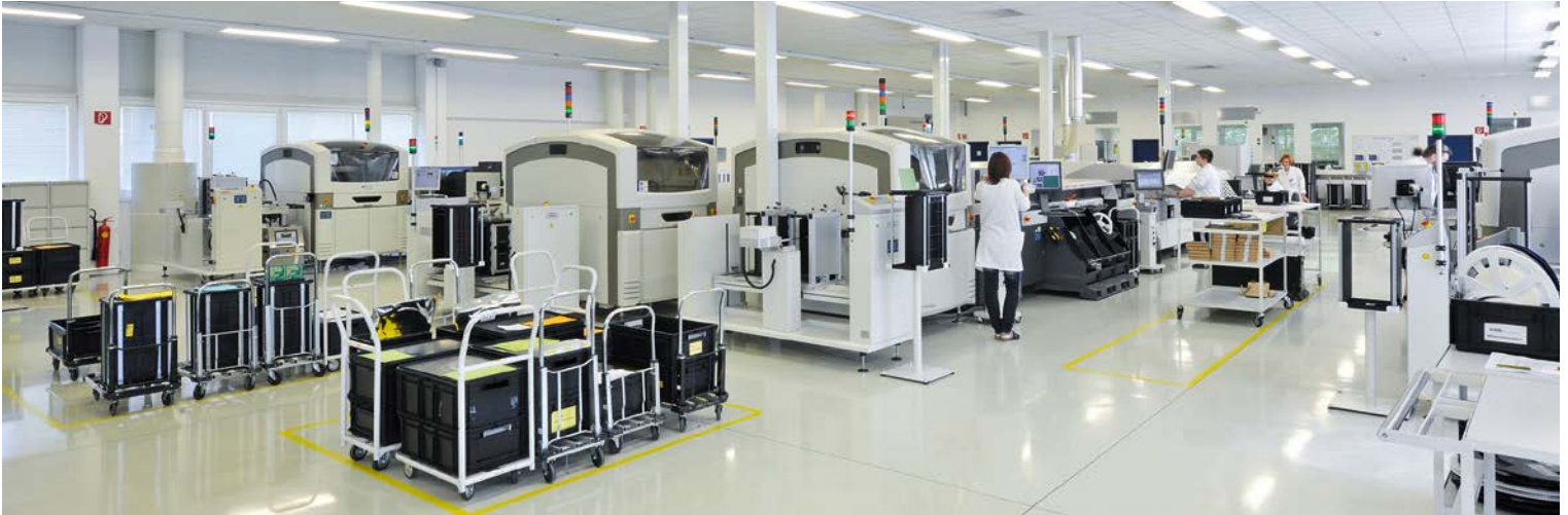
Die SMT-Halle ist genauso modern wie die Elektronik, die cms dort produziert